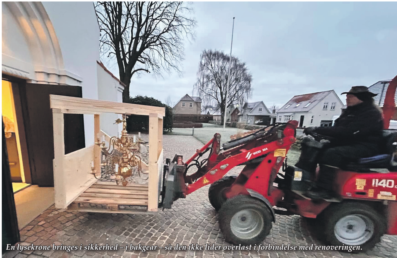
En lysekrone bringes i sikkerhed – i bakgear – så den ikke lider overlast i forbindelse med renoveringen.

Vi skrev i det første nummer, at hovedgaden i Nordby på Fanø hedder Storegade som i Bramming. Den hedder dog Hovedgaden. Desuden skrev vi vadehavsområdet med stort begyndelsesbogstav. Det er med lille som et danmarkskort. Vi beklager.