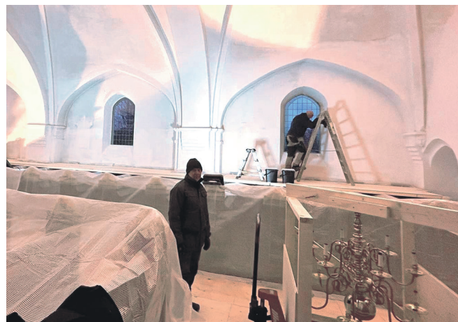
Alt inventar er fjernet og bænkerækkerne dækket af plastic, for at give plads til arbejdet med at kalke kirkerummet.