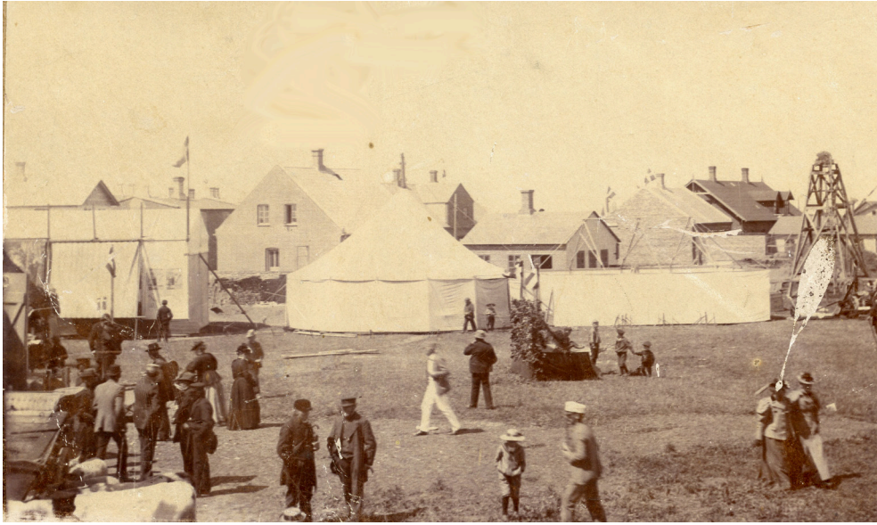
Dyrskuepladsen lå mellem Nørregade, Skolegade og Sct. Knuds Allé. Fotografen har stået nogenlunde der, hvor Sct. Knuds Allé 3 er nu. Det vides ikke hvad 'olieborestation' yderst til højre er brugt til. En talerstol er rejst midt i billedet.

Byen og Hotel Kikkenborg var allerede dengang et samlingspunkt for studehandel. Byens første dyrskue fandt sted den 26. juni 1896 – det sidste i 1974