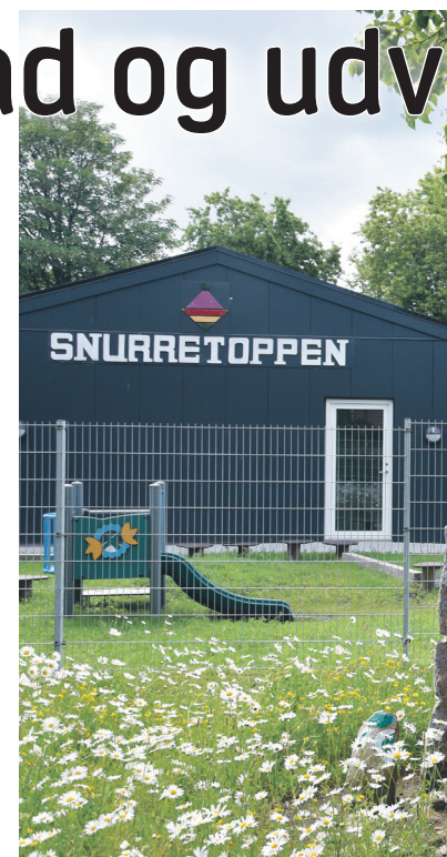
Håbet er, at det nye forældrenævn vil med forældrene – også forældrene til