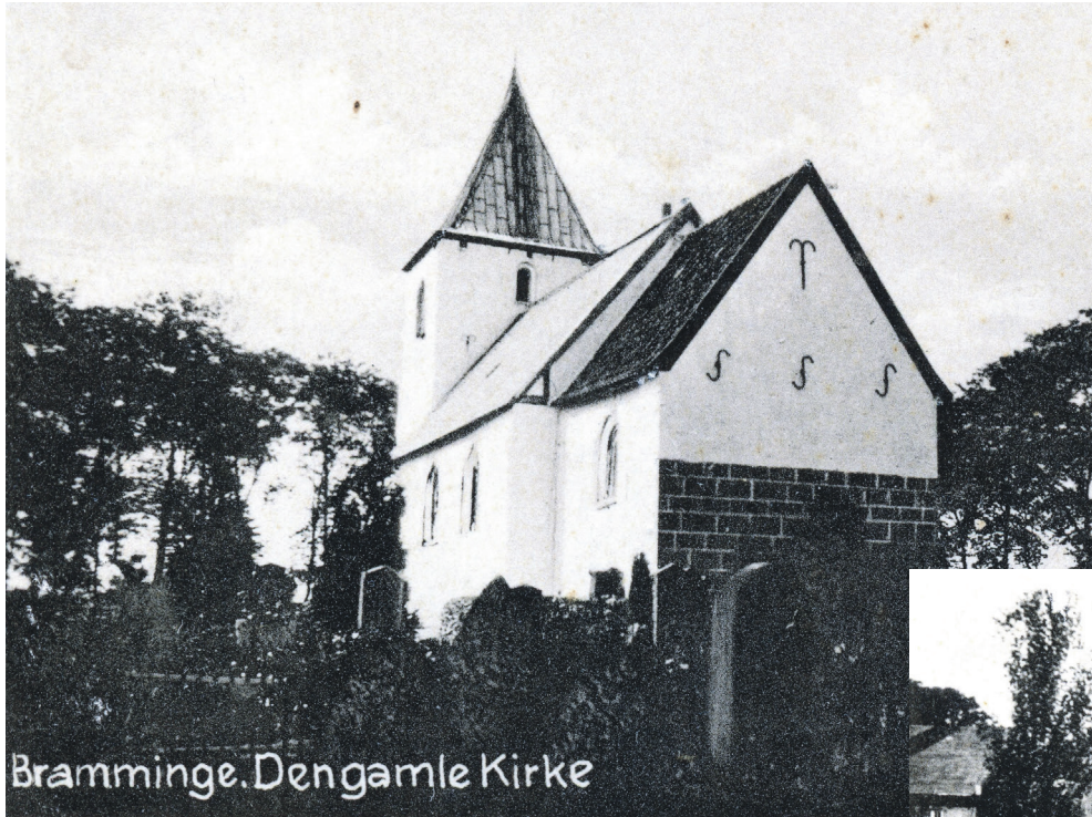
Sct. Knuds Kirke og Bramming Hovedgård. Kirken og kirkegården ser i dag ud, næsten som på det gamle foto. Bemærk beplantningen foran hovedbygningen, samt sidefløjen til venstre. Kirken befinder sig cirka 100 meter syd for hovedgården. Billederne er fra perioden 1920-40.

I 1874 hed den Kikkenborg Krogård. Det var en stor tre-længet, stråttækt bygning med tilhørende