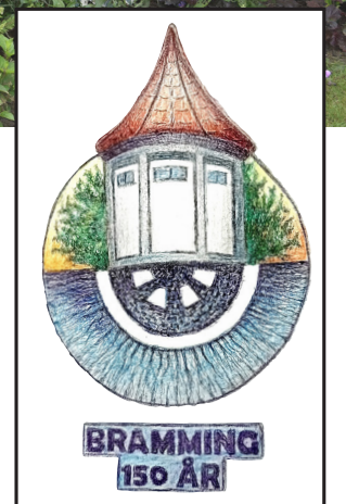
Den lokale kunstner Mogens Jessing har tegnet det officielle logo for byens og jernbanens jubilæum.

Hun fortæller videre, at flere af de eksisterende lysmaster i området vil blive skiftet ud i forbindelse med projektet ligesom der bliver sat en lyskilde op på taget