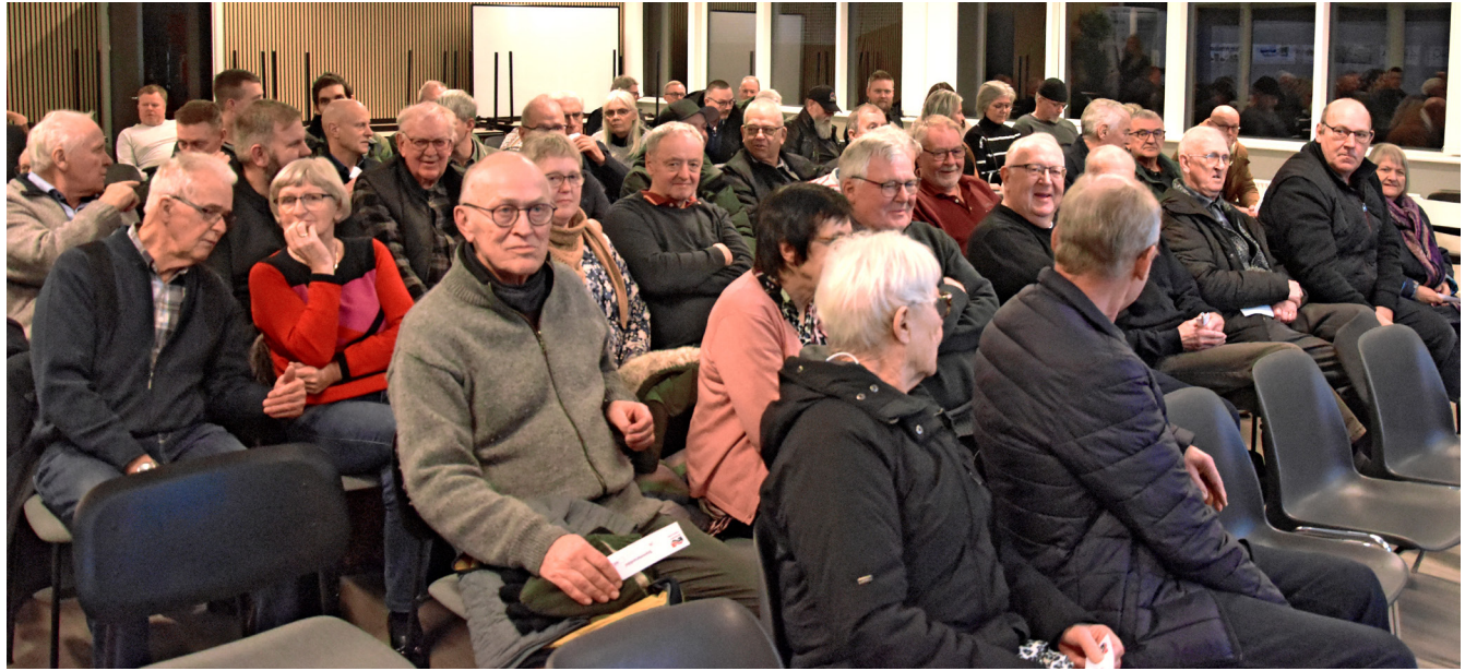
En halv times tid før den ekstraordinære generalforsamling gik i gang, var der stadig ledige pladser. Da klokken slog 19.00 og mødet gik i gang var der op mod dobbelt så mange mennesker i lokalet.

Jo, der er masser at skrive om. Indtil videre er det vel blevet til op mod 250 avissider eller deromkring, og nu har vores avis altså rundet sin et års fødselsdag. I den forbindelse vil vi gerne takke for de mange positive tilkendegivelser vi har fået og stadig får – og vi kan kun opfordre alle til at kontakte os med tip og gode ideer. Vi skal nok være der!